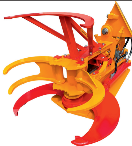
Schnitt-Griffy HS 800 SE