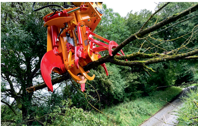
Schnitt-Griffy HS 800 SE mit SG 800 im Greifermodus