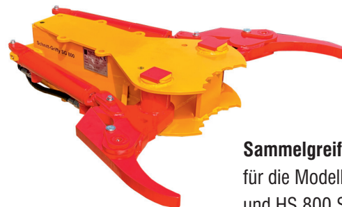
Sammelgreifer SG 800 für die Modelle HS 800 und HS 800 SE

Einsatzgebiet: An Straßen, an Flüssen, im Wald, zur Landschaftspflege, für Kopfweiden, an Bahntrassen, für Überlandleitungen und vieles mehr.