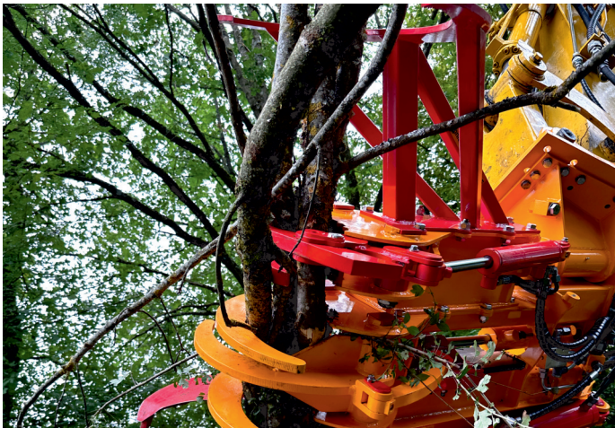
Schnitt-Griffy HS 800 SE mit SG 800 im Einsatz